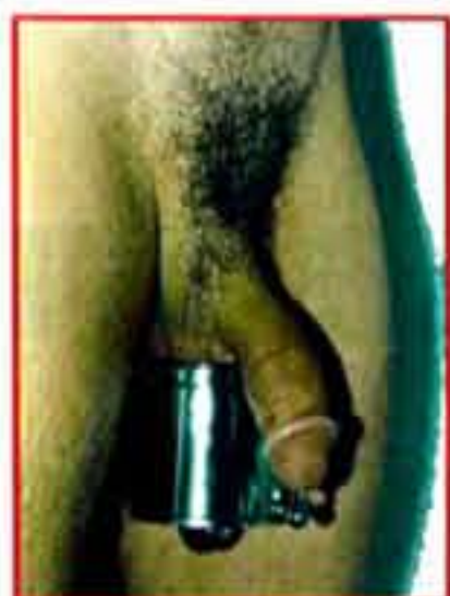
Prince Albert et ball stretcher.