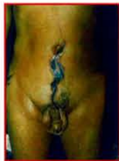
Suivez la flèche !