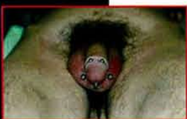
Ampallang, Prince Albert et frein.