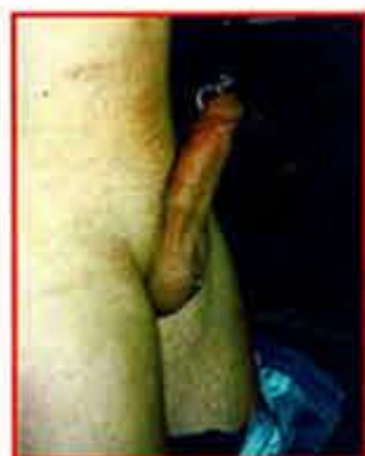
Prince Albert inversé et Afada.