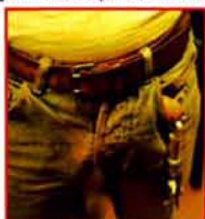
Un usage inattendu du Prince Albert.